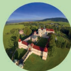
KRÁLÍKY HORA MATKY BOŽÍ Kostel Nanebevzetí Panny Marie