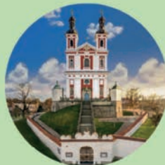
LUŽE Kostel Panny Marie Pomocné na Chlumku