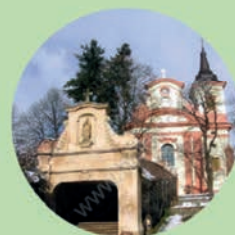
NOVÁ PAKA Kostel Nanebevzetí Panny Marie