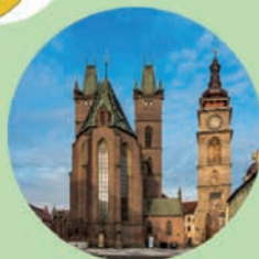
HRADEC KRÁLOVÉ Katedrála Svatého Ducha