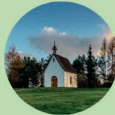
ROKOLE Kostel Panny Marie, Kaple Betlém, Kaple Nejsvětější Trojice