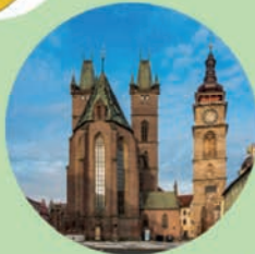
HRADEC KRÁLOVÉ Katedrála Svatého Ducha