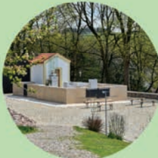
KOČLÍŘOV Kaple Zjevení Capelinha