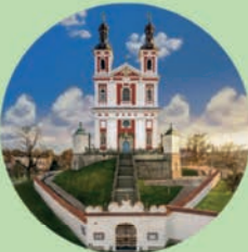
LUŽE Kostel Panny Marie Pomocné na Chlumku