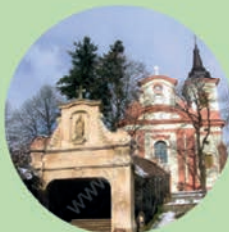
NOVÁ PAKA Kostel Nanebevzetí Panny Marie