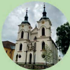
ŽELIV Kostel Narození Panny Marie