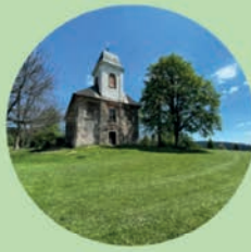
DEŠTNÉ V ORLICKÝCH HORÁCH Kostel sv. Matouše