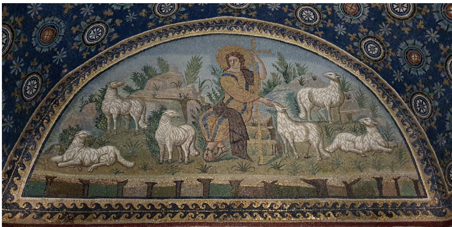
Mozaika Dobrý pastýř – mauzoleum Gally Placidie (z let 425–450)