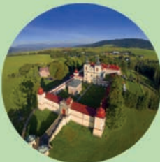
KRÁLUPY HORA MATKY BOŽÍ Kostel Nanebevzetí Panny Marie