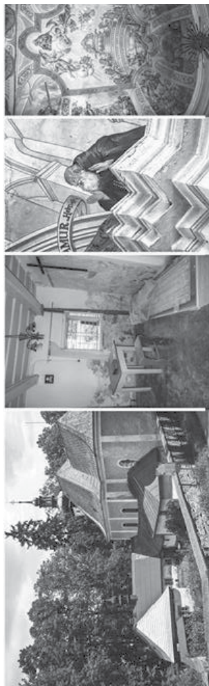
▲ Světový unikát - jediný dochovaný objekt svého druhu na světě