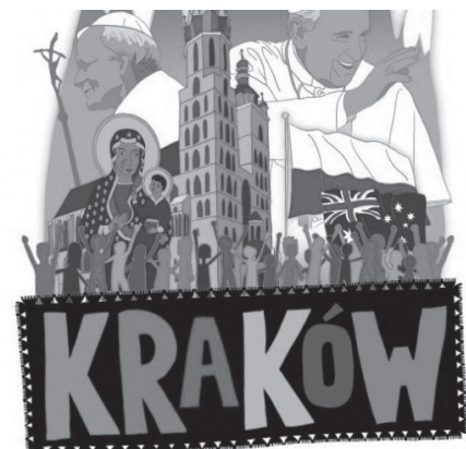
World Youth Day Poland 2016

Pravda je však jiná, drazí mladí, nepřišli jsme na svět „vegetovat“, mít se pohodlně a dělat ze života pohovku, která nás uspává. Naopak, přišli