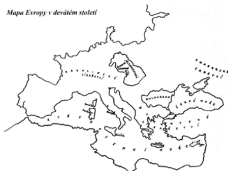
Mapa Evropy v devátém století

www.catholica.cz /Jan Chlumský (kráceno)